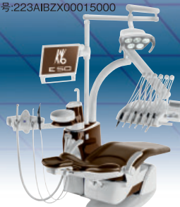
写真にはオプションが含まれています。