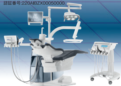
写真にはオプションが含まれています。