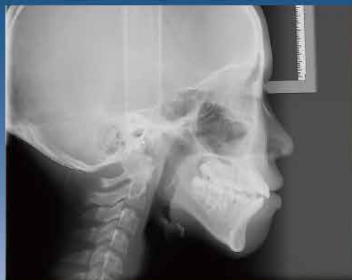
軟組織の視認性も高いセファロ画像