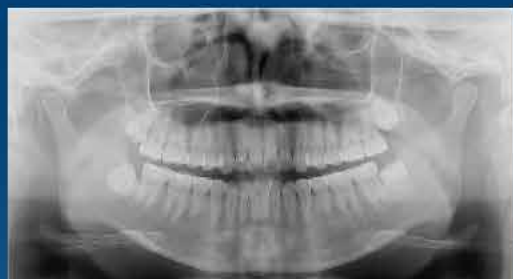
誰でも簡単に綺麗なパノラマ画像を取得