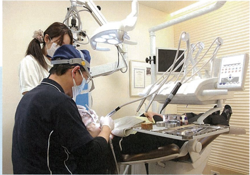
最大90cmの延長可能なホース

カボ社のチェア「エステチカシリーズに待望のスイングアーム式が発売され、昨年の院内改装とともに早速導入しました。私の所属するIPSG包括歯科医療研究会ではパフォーマンスロジック、特に診療姿勢を非常に重要視しております。カボのインストゥルメントは非常にしっかりしているが故に重いのが難点でした（新しいブラシレスモーターは従来と比較して30%も軽量化されています）。そのため、上からインストゥルメントを支え、手にかかる重量を軽減するスイングアーム式が必須となるのです。新たに開発されたアームは90cmまで延長が可能で2段階ロックもできるので、以前のものと比較して屈みこむことのないミラーテクニックによる診療が大変やりやすくなっています。