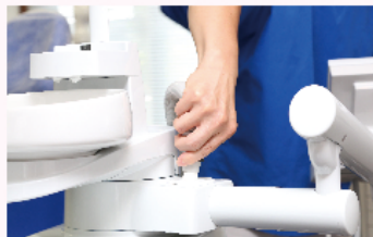
患者さん毎に排水ホースを水で洗浄

いくつかの選定条件のなかで私が最も重きをおいた条件が衛生管理です。これは口腔外科医でもある父の要望もありました。昨今、某新聞社でのタービン類の滅菌について記事が出て患者さんの関心も高くなっており、当院でも問い合わせが数件ありました。このことから患者さんの医院の使用機材の衛生管理に対する意識が高くなっていることが伺えます。