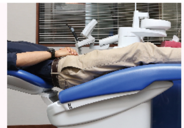
腰が沈み込まない高反発のシート構造 患者さん (体重 60 kg)

トリートメントユニット選定にあたり、私が決めていたいくつかの条件があり、その一つが快適性でした。国内外問わずいくつかのメーカーのトリートメントユニットを見にショールームに行き、実際に自分が座り治療される体位を試しました。個人的にはやや堅めな感じが好きなのですが KaVo のトリートメントユニットはヘッドレスト、バックレストの調整の自由度が大きいため他のメーカーに比べ、座った状態でも快適に感じ、寝かせた状態でも腰に一番負担が少ないように感じました。