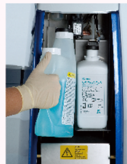
オキシゲナル6とデカセプトルゲルがビルトイン

KaVo のトリートメントユニットの特徴の一つでもある給排水の消毒管理システムは非常に有効です。給水では消毒された安全な水が使用でき、排水では洗浄消毒が自動で行ってもらえる。この二つは医院運営において非常に魅力的でした。患者さんの治療を安全、安心に行えるだけでなく、日々これらの器具を掃除、管理してくれるスタッフの安全も確保できるからです。また、排水系ホースが簡易洗浄ができるアクアマットも KaVo ならではの機能です。