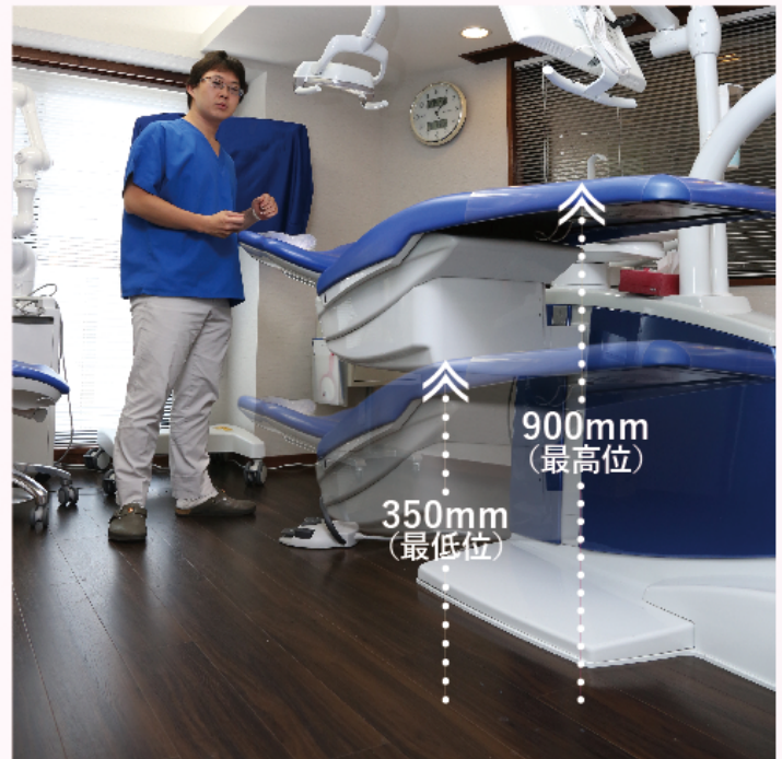
立位でもか屈みこまず自然な姿勢で治療ができ、腰の負担を軽減 (先生の身長 171 cm)

ドイツの開業医の先生のクリニックを見学しましたが、その先生が立位で行っていることが多かったので、治療の内容によりますが形成など私もなるべく立位で行うようにしています。立位で行うことで、座ったまま同じ姿勢での治療が少なくなり腰の負担を軽減します。KaVo のトリートメントユニットは、最高位が高く立位での治療にも適しています。