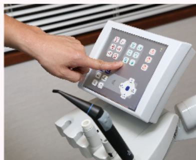
ボタン一つで集中水消毒システムを実施