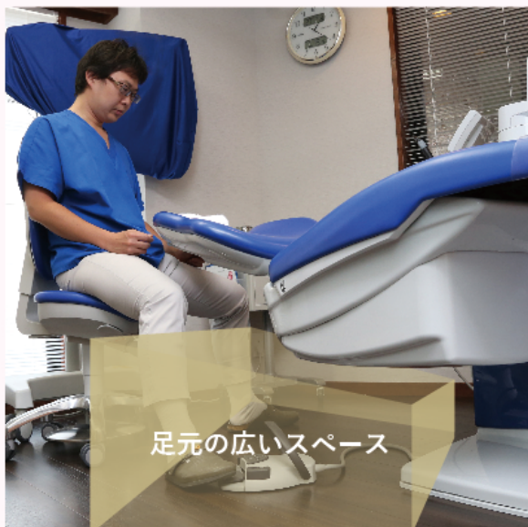
足元の広いスペース