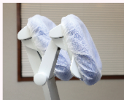
前後にも可動し 個々の体形にフィット

背中丸いお年よりの場合でもヘッドレストを前に出すことでフィットさせることができます。昨年ドイツの本社で腰、背中への保護に基づき立位を基本として設計しているとの説明を受けました。