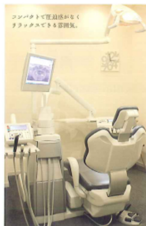
コンパクトで圧迫感がなくリラックスできる雰囲気。