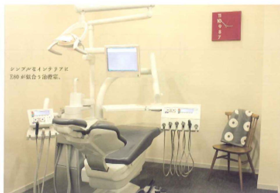
シンプルでインテリアに E80 が収まる治療室。