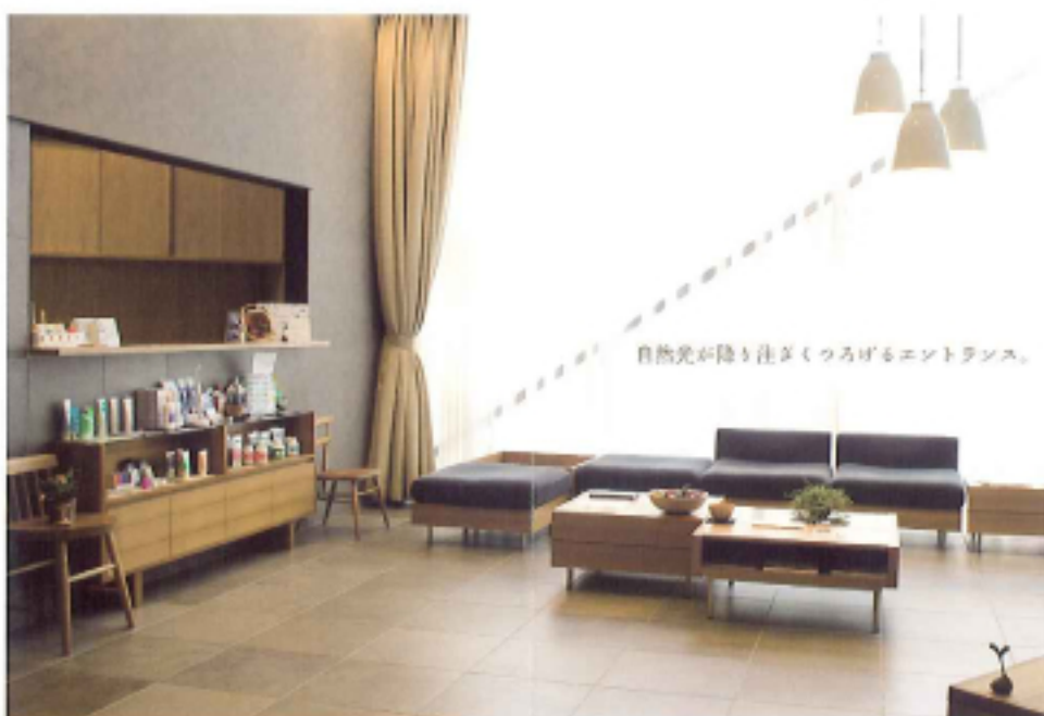
自然光が降り注ぐくつろげるエントランス。