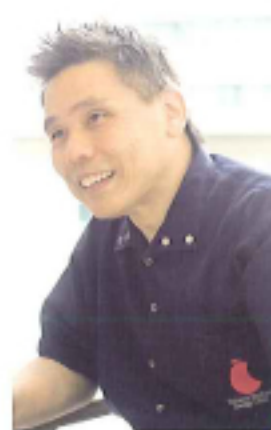
近付かないとできない治療もありますから。

吊り下げタイプの新しいチェアは患者さんを膝の上に抱きかかえる感じでびっくりするほど治療しやすいですよ。楽な手入れもコスト削減に繋がりますね。