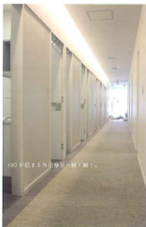
E80 が収まる各治療室へ続く廊下。