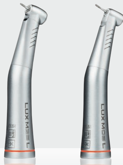
KaVoマスターマティック LUX M25 L (スタンダードヘッド)