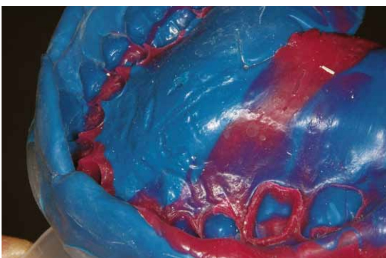
テイク1アドバンストレーとスタンドアウトの連合印象 スタンドアウトは販売が中止され、現在はテイク1アドバンスのLBウォッシュとRBウォッシュが対応する。

しかし、この組み合わせの印象方法は、数歯対象の片顎印象であれば、ガンタイプのカートリッジや、アシスタントでも対応できるが、全顎印象となると力とスピードが必要となるため困難を要する。その為、この自動練和器用のポリリウムタイプは、当オフィスにとつて非常に重宝している。また、カートリッジに充填済なので、アルミパックをカートリッジに装填する操作は不要で、スムーズな交換が可能である。