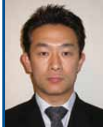
埼玉県 青島デンタルオフィス