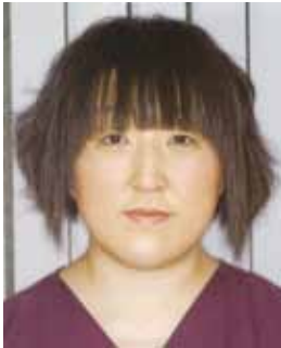
山形県 日吉歯科診療所 歯科衛生士