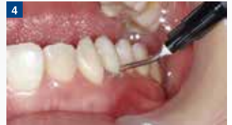
充填:ハーキュライト ウルトラフローのチップ先端を切縁側に置き、レジン少量出す。