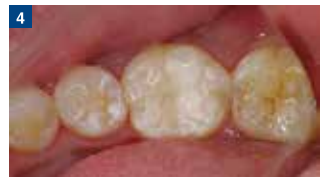
術直後:ハーキュライト ウルトラフローによる1級修復の完了。