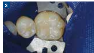
充填直後:各咬頭ごと充填を行ったところ。