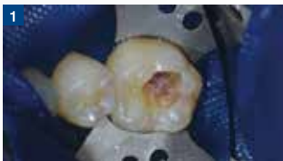
窩洞形成:旧CRを除去し、感染象牙質を除去した。