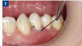
バリの除去:圧排糸を除去し、スクレーラーによりマージン部のバリを除去する。