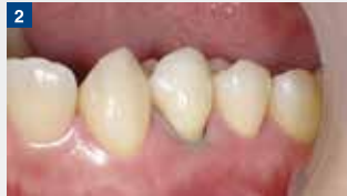
歯肉圧排:歯肉圧排により歯頸部マージンを露出させる。