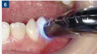
光照射:形態付与の後、直ちに光照射を行う。