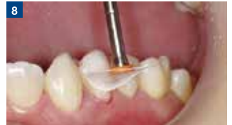
形態修正と研磨:オプチディスクにより形態修正と研磨を行う。