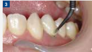
接着処理:2ステップボンディングシステムであるオプチボンド XTRによる接着処理。