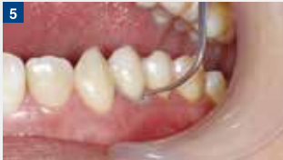
付形:探針で歯頸側に少しずつ移動させる。