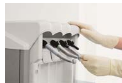
確実な注油でインストルメントのダメージを軽減