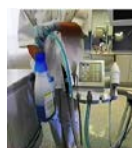
デカセプトルゲルによるホースのクリーニングと除菌