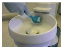
銲の除菌とクリーニング