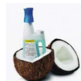
環境に優しい ヤシの実成分