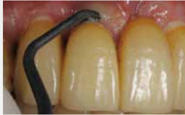
ユニバーサルタイプのデブラーカーを用いてスケーリング