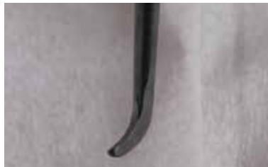
シャープニング後、エッジが立っているのがわかる