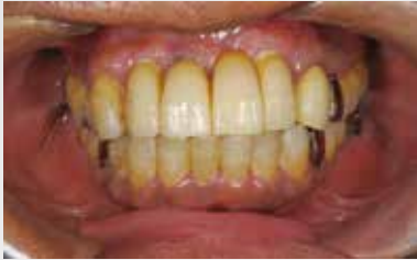
上顎前歯歯頸部にプラークが見られる