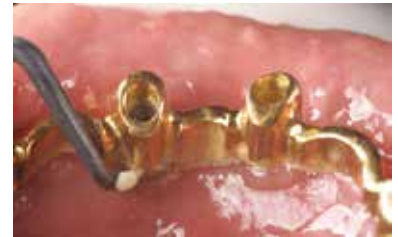
平滑面はオロフェイシャルタイプを使用