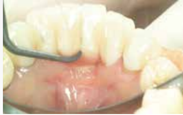
ユニバーサルタイプを用いてスケーリング