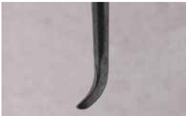
シャープニング前