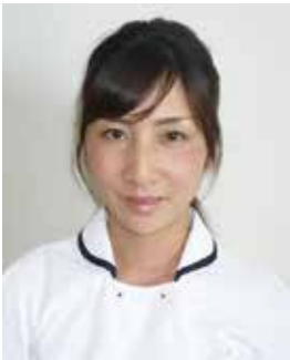
奈良県 松川歯科医院 歯科衛生士