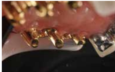
デブラーカーにより、簡便に行うことができた