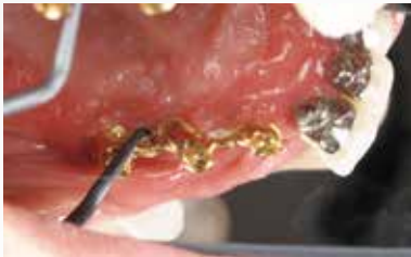
超音波スケーラーでは除去しにくいドルダーバーをユニバーサルタイプでスケーリング