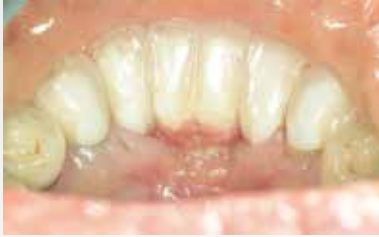
下顎前歯インプラント部(歯肉つきの技工物)歯頸部、歯牙部共にプラーク、歯石の沈着が見られる