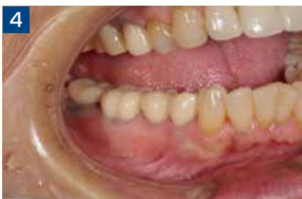
4 プロビジョナルの余剰セメント除去後。除去は簡単に行うことができる。