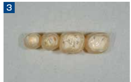
3 プロビジョナル内面にテンプボンドを塗布。操作性、硬化時間も臨床的に優れる。