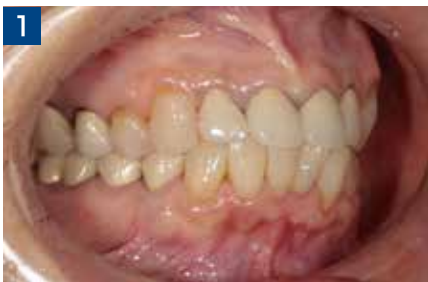
1 下顎右側臼歯部のブリッジ再装希望で来院した患者の初診時口腔内。

いずれにしても仮着材の使用範囲がプロビジョナルあるいは補綴物と広く、テンプボンドは中でも秀逸なマテリアルである。