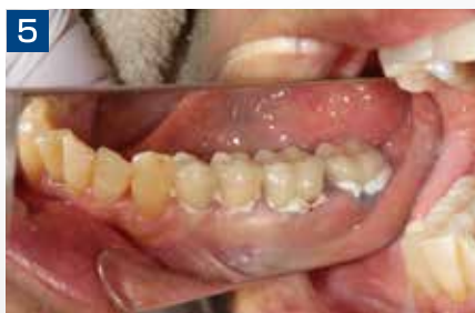
5 最終補綴物の仮着。維持力も適切であり、長期的な仮着にも向いている。