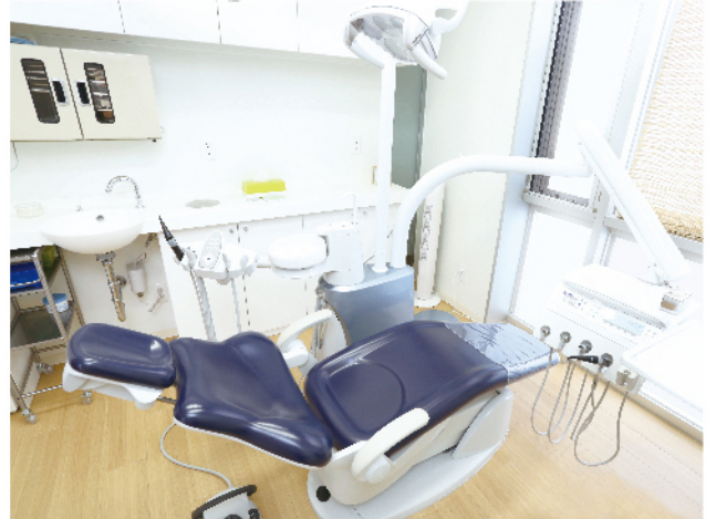
シームレスで清掃が容易な表面

KaVo社エステチカE50デンタルチェアの特徴として、他社製品ではプラスチック等の素材にしてしまっている箇所にスチールを多く用いています。それをクラフトマンが何層にもわたり塗装します。このため、美しく剛性が高いことが特徴として挙げられます。特に、背板部の剛性が高くチェアを倒した際に患者さんをしっかりとポジショニングし安定感が生まれます。また、チェアのクッションがもう一つの特徴です。これは、人間工学を基に設計された堅さです。最初は、少し堅いと思われる患者さんの声も聞こえ、失敗したな！と思いましたが、今では、診療時の疲労感が少なくなるようで好評です。また、表面素材もつなぎ目のないシームレスに張っているため、清掃性がよく、清潔感の高い状態をいつでも維持することが可能となります。歯科医療は、クリーンな環境が求められますし、メンテナンスを考えてもハイスペックなトリートメントユニットといえるでしょう。