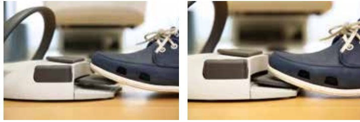
スライド式で左右に足をそと動かすだけで、速度を正確にコントロール 踏み込みの力加減の調整がなく、筋肉の緊張を軽減

フットコントローラのペダルの踏みしろが浅く、回転のON/OFFが実にシャープです。私の診療では、小児のう蝕処置に役立っています。処置中に予測不可能な反応を示した場合、フットペダルを離すと即座に回転がストップすることは、安全な医療を提供するために非常に役に立つと考えます。