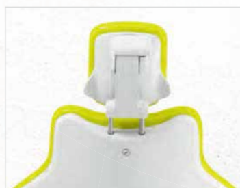
ダブルジョイント式ヘッドレスト 容易にクッションを取り外せ、上下を逆さに装着できます。