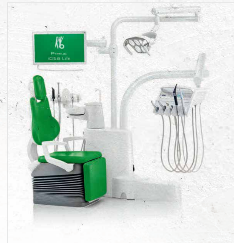
コンパクトチェア 最高位 730mm 最低位 455mm パネル色：デンタルホワイト シート色：エメラルドグリーン

プリムス 1058 Life には右利きと左利き用のトリートメントユニットを揃えています。