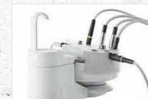
長期間ユニットを停止する際の集中水消毒