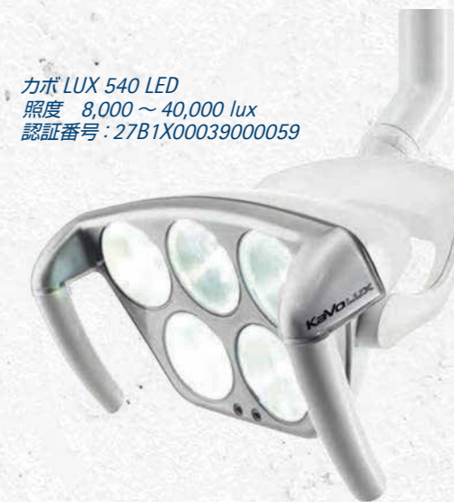
カボ LUX 540 LED 照度 8,000 ~ 40,000 lux 認証番号: 27B1X00039000059