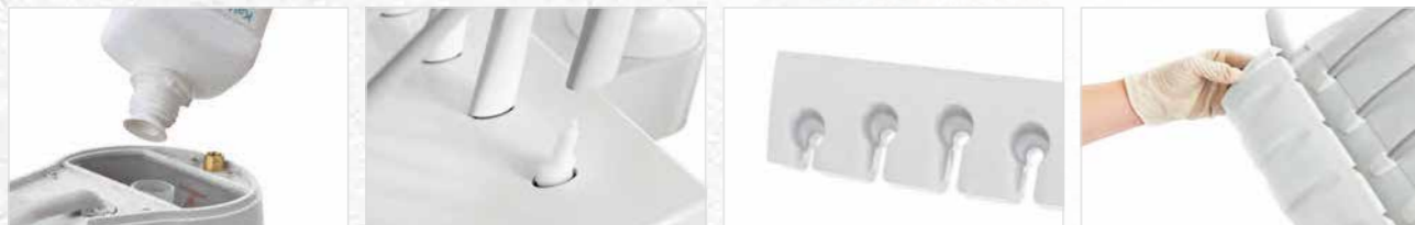
ハンドル、シリコンマット、スピットンボウル、インスツルメントトレイ、スイングアームクランプは簡単に取り外して消毒できます。

プリムス 1058 Life の清掃はとても簡単です。主要コンポーネントは、素早く取り外して消毒できます。吸引フィルターは衛生的なフィルターキャップで、簡単かつ安全に交換可能です。