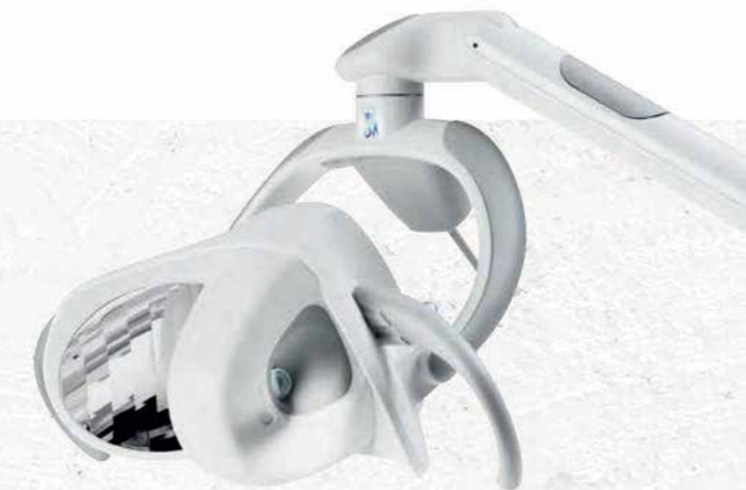
MAIA LED 照度 3,000 ~ 35,000 lux 届出番号: 27B1X00039000069

カボ LUX 540 LED の 5 つの光は、高品質な自然白色光を実現すると同時に、手を触れることなく ON/OFF ができ衛生管理にも大きく寄与します。(オプション)