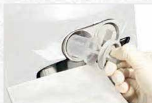
衛生的なハンドルで吸引フィルターを安全に交換できます。

汚染物質がトリートメントユニット内に入らないようにハウジングの上部と下部は完全に密閉しています。