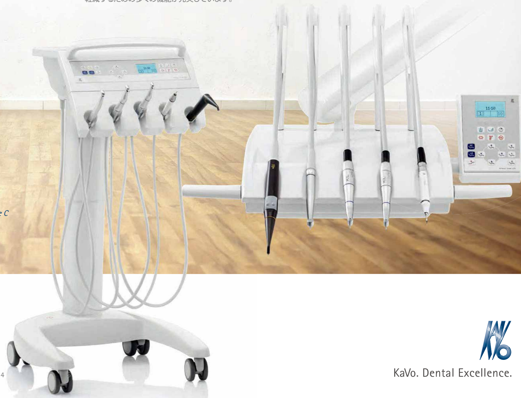
プリムス 1058 Life S

KaVo のトリートメントユニットは人間工学を基本に設計しています。どの位置からでも、あらゆるポジションにストレートにアクセスでき、自然な姿勢で治療を行うことができます。