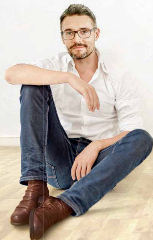
プリムス 1058 Life C