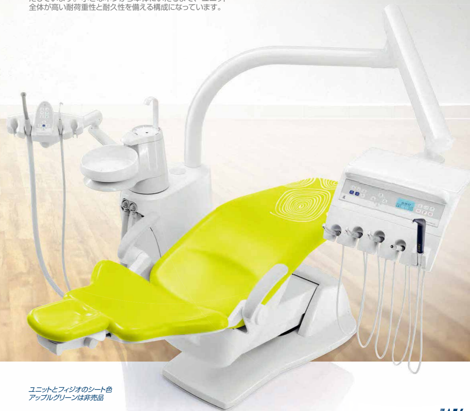
ユニットとフィジオのシート色 アップルグリーンは非売品

KaVo は、将来にわたる信頼性を確保すべく、製品に対して広範な試験を実施し、日常診療における耐久性を確認しています。