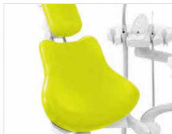
プログレスバックレスト 患者さんへの容易なアクセスを実現