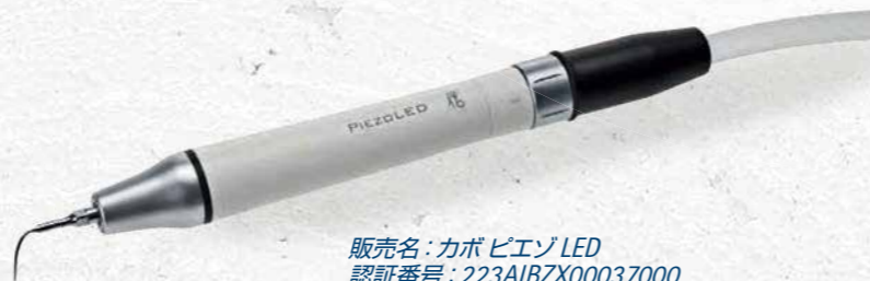
販売名:カボ ピエゾ LED 認証番号: 223AIBZX00037000

ピエゾ LED のチタニウム製ソノロードは、制御された線形振動を実現し、効果的な治療を可能にします。精密に操作できるため、デリケートな部位でも歯や歯肉を痛めることはありません。17 種類のチップで幅広く治療に対応しています。インテリジェントフィードバックコントロールにより、治療中の加圧が一定になるよう自動的に出力レベルを調整し安全で高いパフォーマンスを実現します。(オプション)