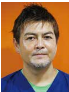
神奈川県 ざくろ 歯科