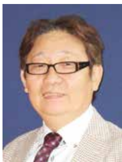
愛知県 山下歯科医院