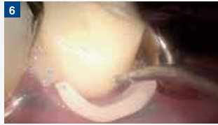
1~2秒のタックキュアにより余剰セメントはゲル化。探針で簡単に除去できる。