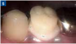
補綴物のセット。全周より溢れるように十分なセメントを使用する。