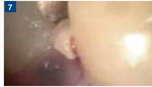
ゲル化での除去は、隣接面の歯肉にダメージを与えにくい。タイミングを逃して完全に硬化すると除去しづらくなるので注意する。