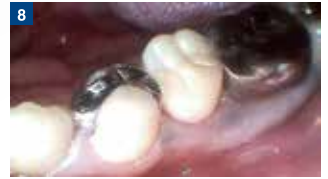
術後の経過も良好である。