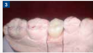
補綴物の準備。今回はCAD/CAM冠を装着する。