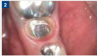
メタルクラウンを除去し、プレパレーションを行う。