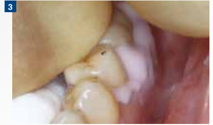
3 過度な重合反応によりセメント除去の適切なタイミングを逃さないよう、筆者の臨床では「少し離して1、2秒照射、その後、化学重合が進行してピンク色が抜けるのを待つ」ことを基本としている。ここは術者の好みであり、光照射を行わずに化学重合のみで待つことも可能である。