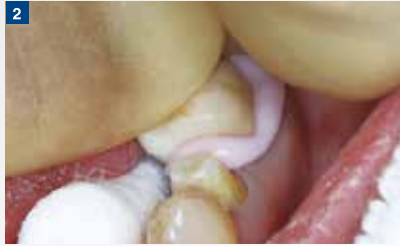
2 デュアルキュアタイプのため、補綴物の圧接が完了したら光照射により余剰セメントの重合反応を促進する。