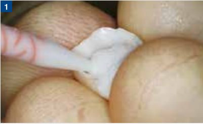
1 オートミックスシリンジを用いて、セメントを補綴物内面に注入。ペーストはすぐにピンク色に変化する。