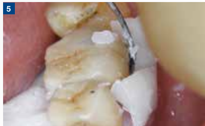
5 適切なタイミングでセメント除去の操作に入れば、セメントが柔らか過ぎず、硬化し過ぎていないこともなく、一塊で容易に除去できる。