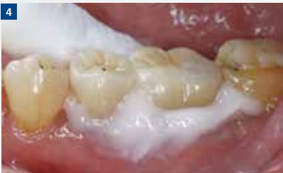
4 重合反応によりピンク色が明確に消失してくるので、タイミング良く余剰セメントの除去を行う。ピンク色が完全に抜けたときは硬化がほぼ完了しているの、色が消えるのを待ち過ぎないように注意する。