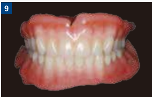
完成義歯(正面) 協力:須藤 哲也(Defy)