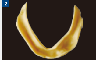
下顎各個トレーの内面。