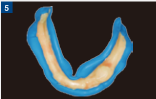
辺縁部の印象採得後、内面に入った印象体を取り除いたところ。舌下ヒダ部に深さと厚みが得られている。