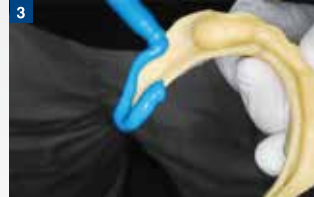
辺縁形成用のテイク1 アドバンス トレーを盛る。