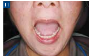
完成義歯はしっかりと吸着しており、大きく開いても下顎義歯が浮き上がることはない。