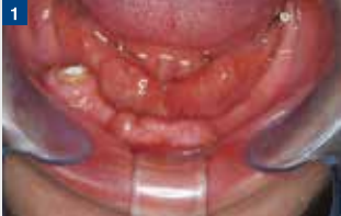
術前の口腔内写真:舌下ヒダ部には豊富なスポンジ状組織が存在しているため、深さと厚みのある印象体を得ることが期待できる。(右下小白歯部は後日、根面板となった)