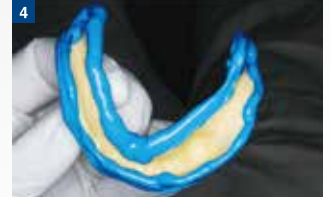
辺縁全周囲が盛られた状態。高粘度のため垂れることがない。