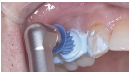
クリニークチューブのペーストは、歯面にしっかり作用する。