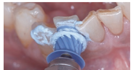
歯列不正でもカーのプロカップは、側面での研磨が可能。