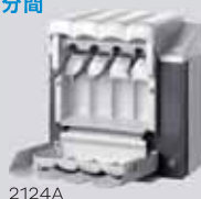
クアトロケアプラス 2124A