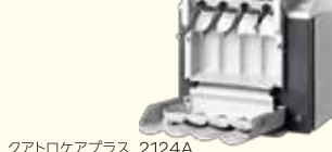
クアトロケアプラス 2124A