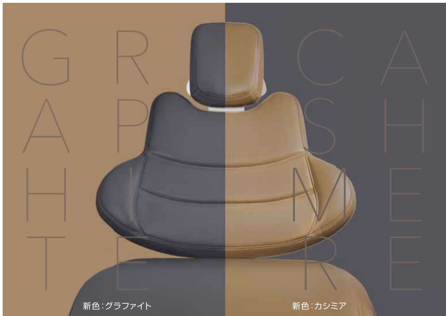
新色：グラファイト