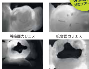
隣接面カリエス 咬合面カリエス 二次カリエス クラック