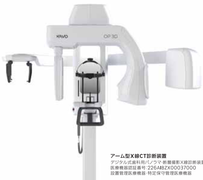
アーム型X線CT診断装置

デジタル式歯科用パノラマ・断層撮影X線診断装置 医療機器認証番号:226AIBZX00037000 設置管理医療機器・特定保守管理医療機器