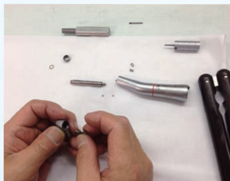
5倍速コントラアングルの分解