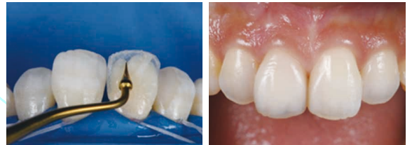
ハーモナイズを用いた掲載症例(中切歯Ⅳ級)

※時間的制約もございますので、ご質問は限らせていただくことを予めご了承願います。