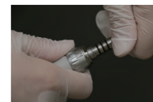
手元で注水量を調節

ハンドピースの注水量が豊富で、歯牙やバーの過熱を防いでくれます。注水量が手元で調整できるので、形成の仕上げの際は注水を減らしています。