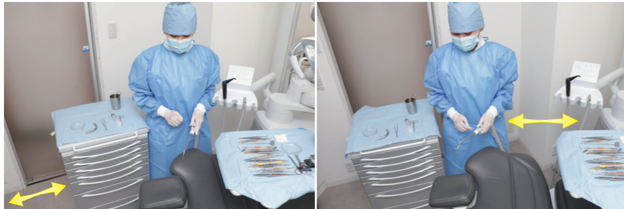
足元の方にチェアをポジショニングした場合：キャビネット周辺のスペースが確保できる。