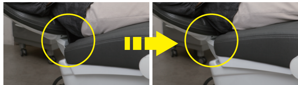
角度を調節して患者さんの腰をサポートするチルト機能